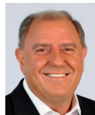
Siegfried Schrittwieser Landeshauptmann-Stellvertreter

„Durch die gut geplante Sanierung eines Gebäudes kann viel Energie eingespart und damit eine Senkung der laufenden Betriebskosten erreicht werden. Darüber soll unsere Beratungs-offensive aufklären und somit den Stellenwert des Energiesparens und der Energieeffizienz nachhaltig klar machen.“