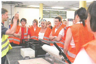
FRAUENNETZWERK. Haus-Graz-Mitarbeiterinnen beim Besuch der Abfallwirtschaft.