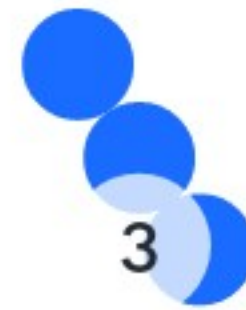
(Öffentlich-Private-Partnerschaft) Public Private Partnership